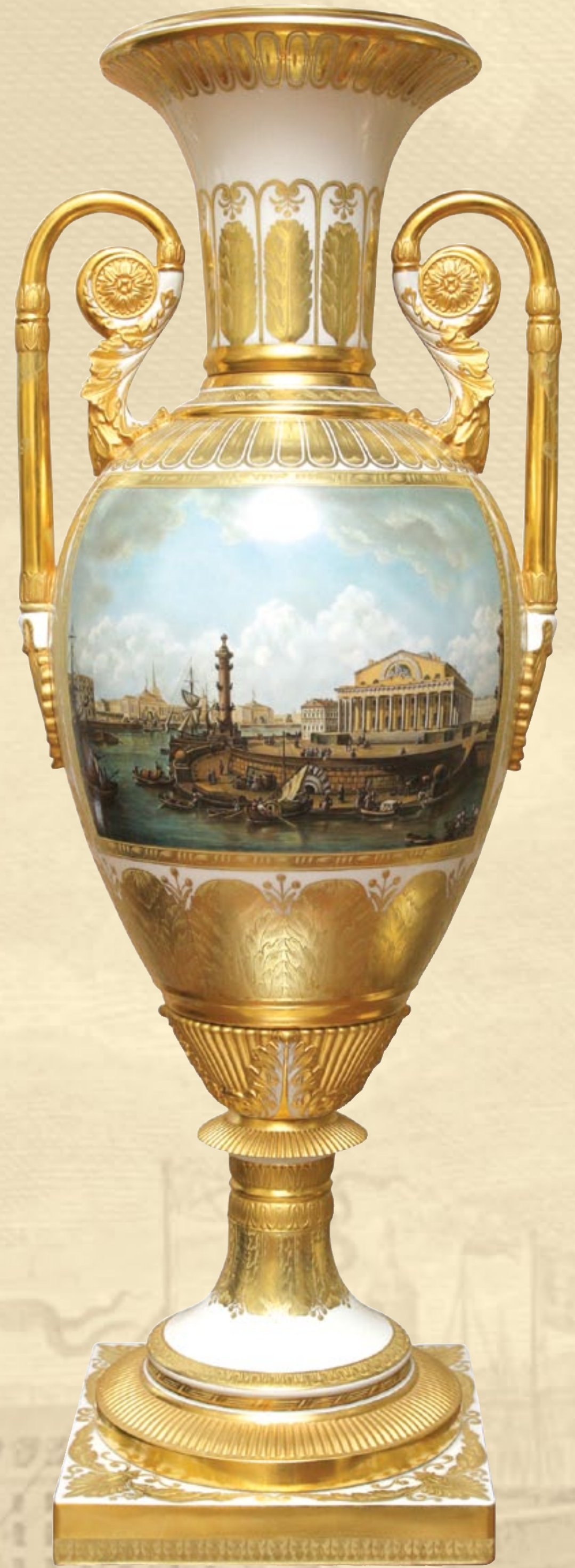
Vaza „Majiljovo salos vaizdas“. 2008. Dekoratorius N. J. Boblakova. Formos pagal XIX a. I pusės porcelaninį autorius – J. F. Troickij. Vase „View of Mayjensky Island“. 2008. Decoration by N. J. Boblakova. Form after a piece from the first half of the 19th c. by J. F. Troickij

MUSEUM OF THE RADVILAS PALACE (24 Vilniaus St., Vilnius)